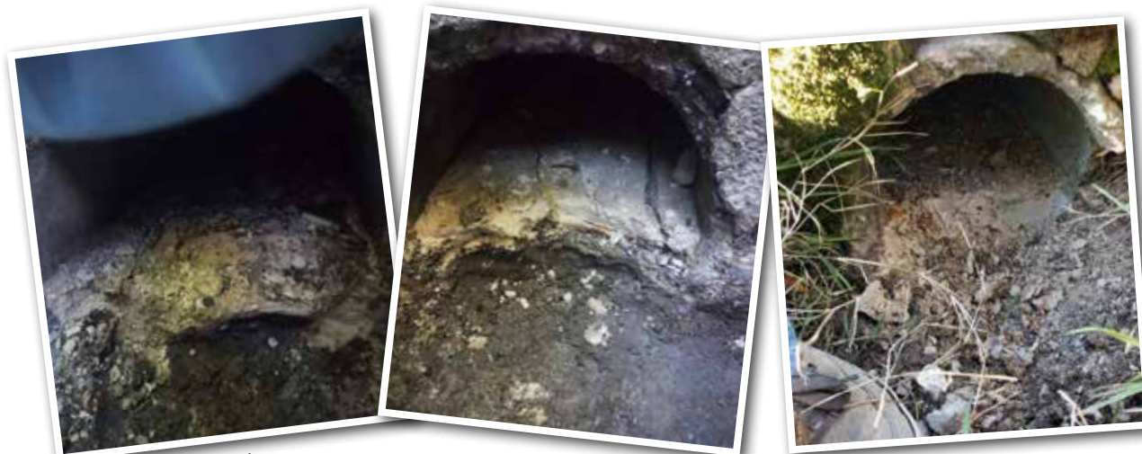
Rue de la Coudraie

Dans le cadre des travaux de la mairie, la place a été aménagée, mettant en valeur le monument aux morts. Des places de parking ont été tracées, bien que peu nombreuses, nous vous remercions par avance de les respecter.